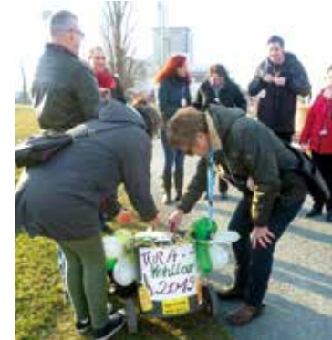
Ohne den obligatorischen Versorgungswagen mit den „Überlebens-Mitteln“ geht bei der Kohlfahrt natürlich gar nichts.

Diese führte im Februar nach Hemelingen in die „Centralhallen“ (Seekamp's Gasthof). Treffpunkt war zuvor das Weserwehr, von wo aus es dann „per pedes“ -unterbrochen von etlichen Spiele- und Schnapspausen - bis in die Hemelinger Heerstraße zu dem seit über 125 Jahren existierenden Traditionslokal ging. Die „Centralhallen“ zeichnen sich durch exklusive Räumlichkeiten, einen super Service und ein ganz vorzügliches Kohlessen aus.