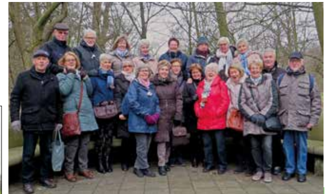
Am 6. Februar unternahm die Walking-Gruppe eine Kohlfahrt zur Meierei im Bürgerpark.

Seitdem haben viele Mitglieder der Gruppe Spaß