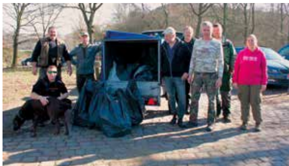
Viel zu tun gab es beim jüngsten Arbeitsdienst der Sportfischer von Tura am Waller Feldmarksee.

Somit verweilen viele Besucher längere Zeit am See und bringen sich zur Stärkung so einiges zum Picknicken mit. Das baut auf, ja, doch die zum Teil zurückbleibenden Verpackungsreste bauen die Artenvielfalt nicht weiter am See auf. Im Gegenteil, alles was an Müll im See landet und dort leider abgebaut und zersetzt wird, ist ein Problem für seine natürliche Selbstreinigungskraft. Vor allem beim Plastikmüllabbau im Wasser und deren Nanopartikel werden die Filterer wie Muscheln und Wasserflöhe zum Teil stark geschädigt. Eigentlich reinigen diese fast ganzjährig