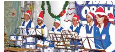
Der Jahreszeit entsprechend „optimieren“ die Turaner ihr Outfit auch manchmal.