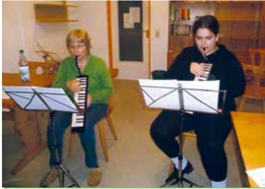
Auch die Melodion-Spielerinnen mussten beim Seminar ordentlich „in die Tasten greifen“.

Das Tura-Repertoire wurde beim 40. Seminar um die sehr unterschiedlichen Titel „Latino Lover“ (Disco Pop), „El Choclo“ (Tango Argentino), das brasilianische „Ai se eu te Pego“ (= „Nossa, Nossa“), „Loch Lomond“ (schottischer Folksong) und den „Wild Cat Blues“ (mit Solo-Kla-