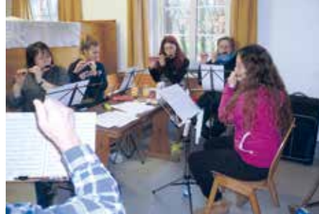
Die Sopranflötistinnen bei der sogenannten „Registerprobe“.

ausführliche, akribisch zusammen getragene Rückschau auf vier Jahrzehnte Lehrgangsgeschichte.