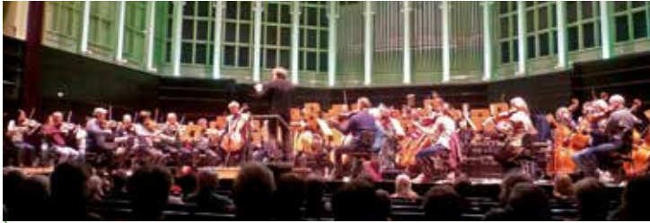
An der Probenarbeit kommen auch Profis wie die „Bremer Philharmoniker“ nicht vorbei.