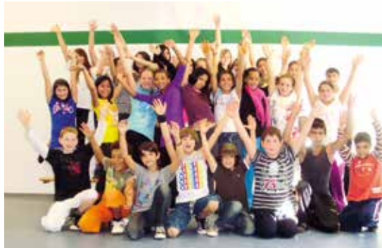
Sie freuen sich über die großzügige Spende: Kinder und Jugendliche beim Tanzprojekt „Dance4Kids“ und beim Bewegungsnachmittag für Kinder

77 interessierte Zuschauer und Zuhörer segelten mit von Bremen ins Mittelmeer und konnten die sechs Monate dauernde Tour neben den Bildern auch über kleine Videosequenzen nachvollziehen. Die letzte Reise führte durch das Meltemi Gebiet der Ägäis in Griechenland und hatte einige Besonderheiten für sie parat. So konnten die Tura-Mitglieder über einen unfreiwilligen Kränkungstest und Ankerwache im Cockpit berichten, von Wunderlebnissen, Wanderungen und Besichtigungen, wie auch über den Besuch auf einer Insel mit einem aktiven Vulkan.