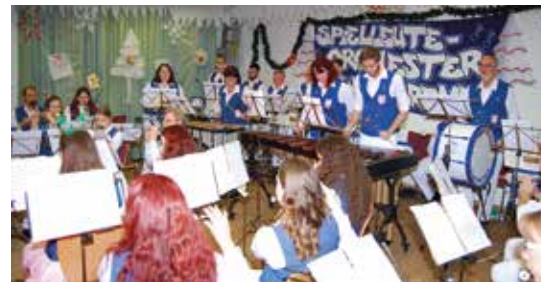
Der Weihnachtsfrühschoppen führt Jung und Alt bei Spekulatius und Kerzenschein zusammen.

Schragestr. 15 / 28239 Bremen Tel.: 694 02 37 / Fax: 694 02 38