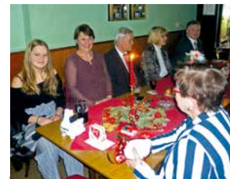
Der Weihnachtsfrühschoppen führt Jung und Alt bei Spekulatius und Kerzenschein zusammen.

Außerdem hilft so ein Frühschoppen natürlich auch wunderbar, den Appetit auf den zu Hause wartenden Festtagsbraten anzuregen.