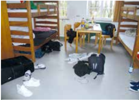
Wenn die Musikanten dermaßen viel üben müssen, dann haben die Zimmer schon mal das Nachsehen...

rinette) erweitert. Die Jubiläumsnacht am Samstag erhielt einen „besonderen Pfiff“ durch eine