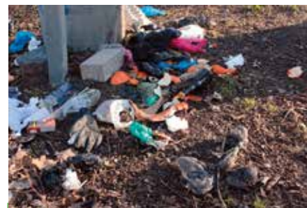
Überquellende Müllgefäße, wild entsorgter Sperrmüll und ungenügende Entsorgung durch die zuständigen Unternehmen bereiten Ärgernis am Waller Feldmarksee.

diese mittlerweile? Bedingt durch die Unterwassernahrungskette und den aufgenommenen Müll nehmen die Fische auch die Plastikteile auf“, er-