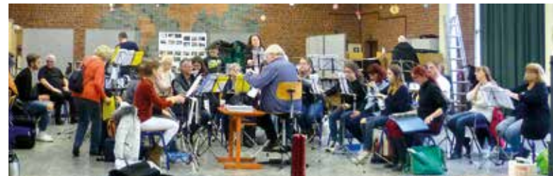
Die Orchesterprobe ist wesentlicher Bestandteil einer ernsthaften Konzertvorbereitung.

Dabei erfordern Titel, die schon seit Jahren