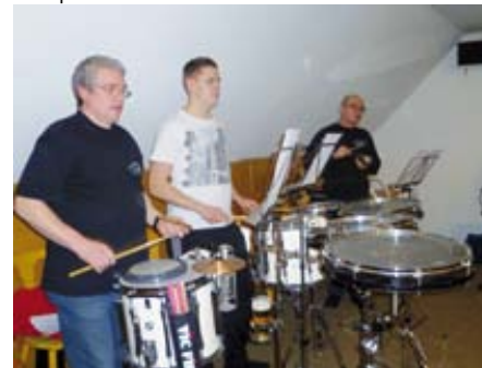
Intensiv arbeiteten Orchestermitglieder von Tura im Schullandheim Dötlingen.

53 Mitglieder der Tura-Musikabteilung legten bei ihrem Lehrgang vom 13. bis 15. Januar im Schullandheim Dötlingen den Grundstein für die Repertoire-Erweiterung in der neuen Spielzeit.