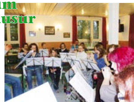
Intensiv arbeiteten Orchestermitglieder von Tura im Schullandheim Dötlingen.

dass im Bootshaus das mittlerweile 25. Percussion-Seminar durchgeführt wurde.