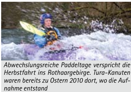
Abwechslungsreiche Paddeltage verspricht die Herbstfahrt ins Rothaargebirge. Tura-Kanuten waren bereits zu Ostern 2010 dort, wo die Aufnahme entstand

Tura Bremen veranstaltet in den Herbstferien eine einwöchige Kanutour in das Rothaargebirge / Sauerland. Unterkunft findet die Gruppe in der Jugend-Bildungsstätte in Eppe in der Nähe von Korbach. In diesem Gästehaus stehen den Teilnehmern mehrere 2-Bett- und auch 4-Bett-Zimmer zur Verfügung. Eine große Küche dient den Teilnehmern zur Selbstverpflegung. Es werden Paddeltouren auf der Lenne, Wenne, Lahn, Eder und Diemel angeboten. Anmeldungen können ab sofort bei Lutz Steenken unter Telefon 0421/629260 erfolgen.