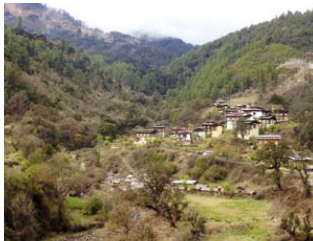
Blick auf das Dorf Chendebji (Bhutan)