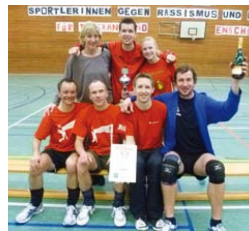
Die Betriebsmannschaft „Ostblock“ von Airbus aus Hamburg gewann das Volleyball-Mixedturnier von Tura Bremen in der Gesamtschule West.