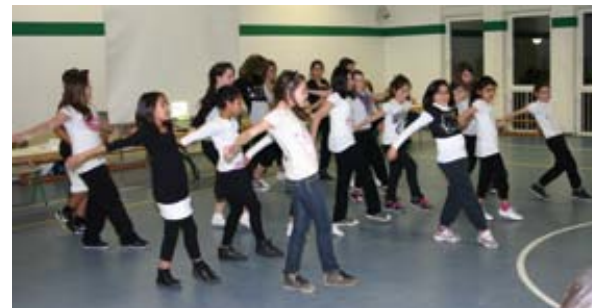
Temperamentvoll begrüßten die jungen Tänzerinnen und Tänzer aus dem neuen Tanztheaterprojekt von Tura die Jahreshauptversammlung des Vereins.