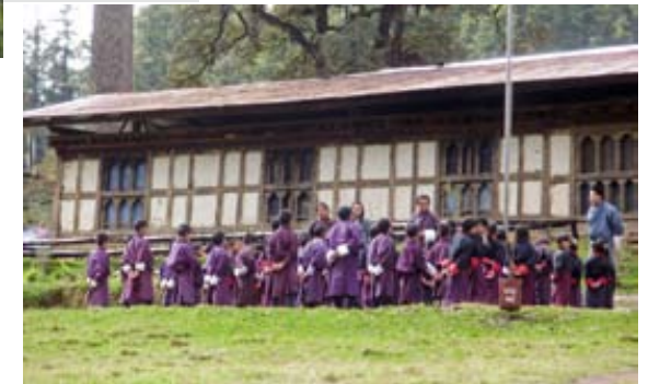
Kinder vor der Schule in Chendebji