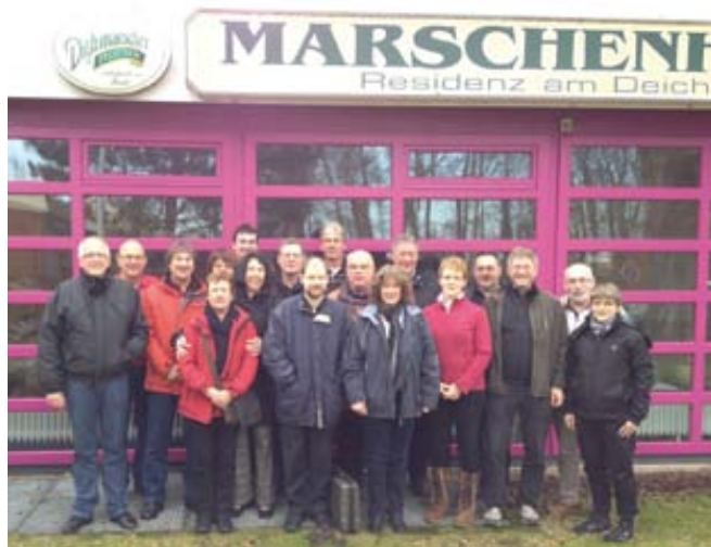
Die Jahreshauptversammlung von Tura wurde bei einer zweitägigen Klausurtagung des Hauptausschusses in Wremen vorbereitet.