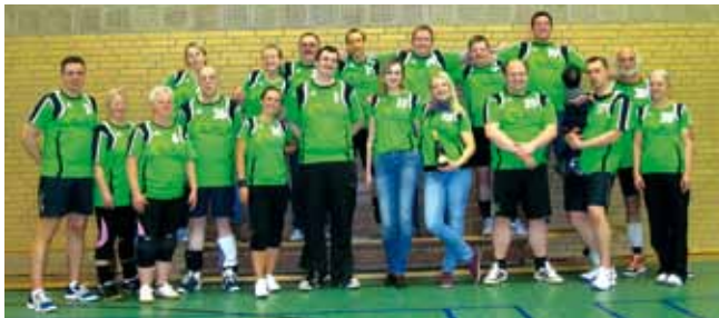
Tura organisierte in der Gesamtschule West das beliebte Freizeit-Mixed-Volleyballturnier. Der Gastgeber trat mit drei Teams an. Ein besonderer Dank gilt den beiden Sponsoren „TauRes“ und „memoria“.

Dank des starken Zuwachses konnte Gastgeber