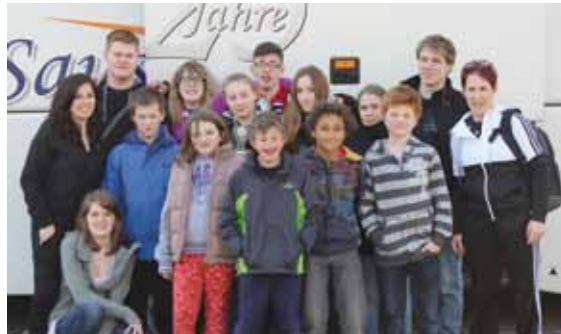
Elf Judoka und Begleiterinnen vertraten Tura beim 36. Bartje-Turnier in Assen/Niederlande