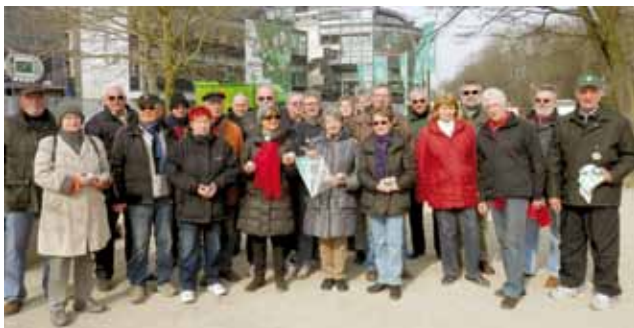
Zu einem gelungenen Bouletreff trafen sich Sportler von Werder und Tura am Weserstadion.

Werder bietet den Boule-Sport seit fünf Jahren im Rahmen des Projektes "60plus" an, während Tura seit gut einem Jahr den Bouletreff als offenes Angebot in Gröpelingen organisiert.