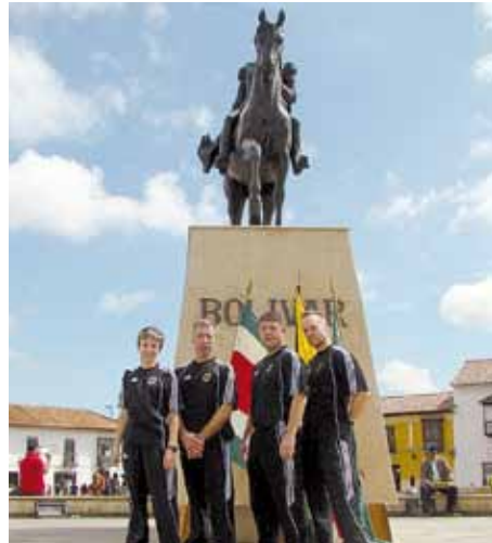
Die WM-Teilnehmer von Tura Bremen vor dem Simon-Bolívar-Denkmal im kolumbianischen Tunja