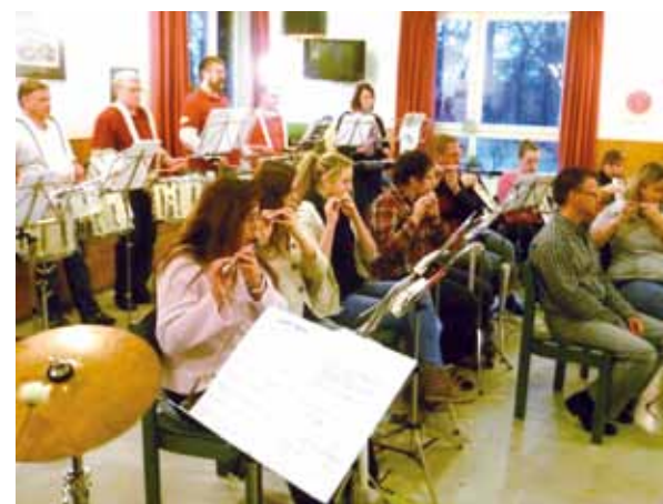
Proben in Dötlingen im Januar 2013