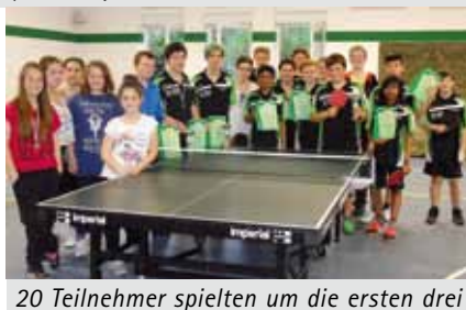
20 Teilnehmer spielten um die ersten drei Plätze im Einzelwettbewerb der Tischtennis-Vereinsmeisterschaften von Tura in den Gruppen Anfänger, Schüler und Jungen.

Bei den Vereinsmeisterschaften erleben sie die spielerische Entwicklung der Kids als Ergebnis des Trainings Woche für Woche. Und bei den Anfängern bedeuten die Vereinsmeisterschaften gleichzeitig auch eine Sichtung für die kommende Saison, wer sich schon dem Punktspielbetrieb stellen kann.