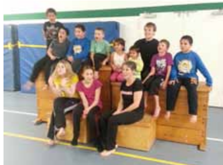
Willkommene Abwechslung für den Judo-Nachwuchs von Tura beim dritten Bodenturnlehrgang.