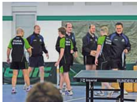
und alle freuen sich auf faire Spiele.