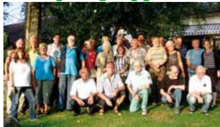
Am 31. Juli haben beide Herzsportgruppen von Tura eine gemeinsame Radtour unternommen. Der Weg führte wieder nach Dammsiel, das Wetter war herrlich und alle Teilnehmer hatten einen schönen Abend.