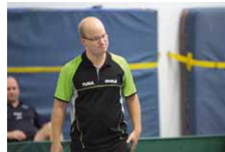
... aber ohne Erfolg.