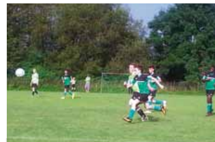
Turnier beim SV Hönisch