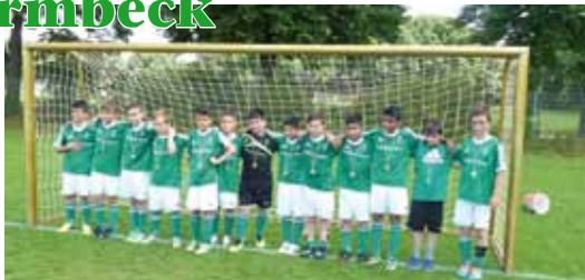
Turas E-Junioren haben eine erfolgreiche Saison gespielt.

Zuvor hatten Turas Nachwuchskicker in der Staffel A 1 den Meistertitel vor Werder Bremen gewonnen. Dagegen ging das Pokal-Finale gegen Werders Leistungsmannschaft mit 0:4 verloren. Die Turaner kassierten in einem kampfbetonten Spiel in der er-