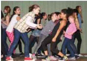
Die Flüchtlings-Kinder begegnen den Kindern in Deutschland.