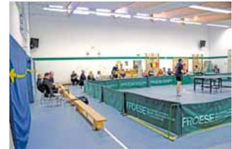
Leider trotz großer Fanunterstützung...