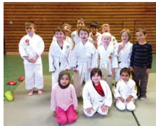
Kinder können bei Tura die Sportart Judo spielend lernen.