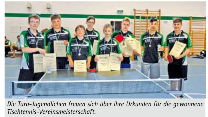
Die Tura-Jugendlichen freuen sich über ihre Urkunden für die gewonnene Tischtennis-Vereinsmeisterschaft.

Mit vielen Emotionen und spannenden Ballwechslern im Vereinszentrum von Tura Bremen spielten 15 jugendliche Tischtennispieler ihre Meister aus.