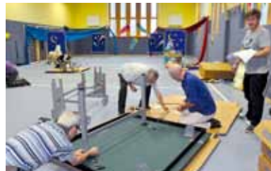
Fleißig gingen die Spieler von Tura zu Werke und bauten die neuen Tischtennistische in den neuen Hallen der Schule an der Fischerhuder Straße auf.

Zahlreiche Spieler beteiligten sich an zwei Abenden am Aufbau der neuen Tischtennistische, die komplett neu angeschafft werden mussten. Die aktiven Helfer waren natürlich auch gespannt, wie die neuen Sporthallen aussehen und freuten sich. Mit dem neuen Schwingboden, der sehr guten Beleuchtung und den neuen Fenstern dürfte das Training noch mehr Spaß wie vorher bereiten.