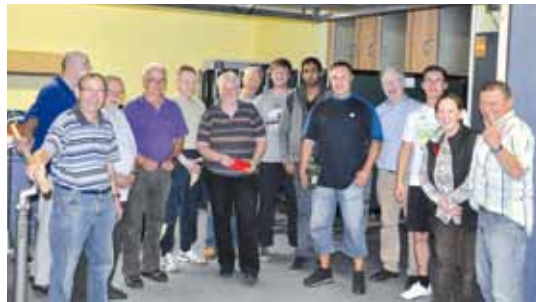
Turas Spieler freuen sich über den Aufbau der Tischtennistische in der neuen Sporthalle an der Fischerhuder Straße.

Auch wenn sich die Spielerinnen und Spieler von Tura in der Ausweich-Halle in der Gesamtschule West sehr wohl ge-