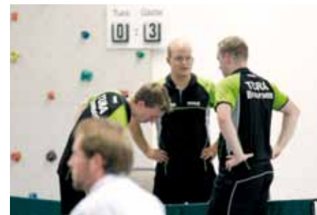
Hat jemand eine Idee?