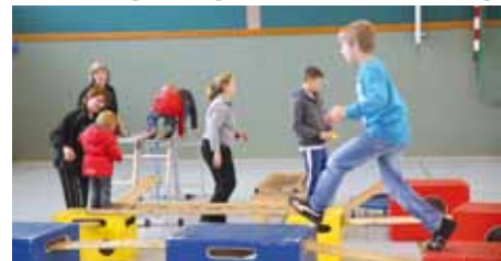
Auf die Kinder warten beim Bewegungsnachmittag von Tura Bremen wieder viele Überraschungen.

Kinder können am Sonntag, 18. Januar, beim Turn- und Rasensportverein (Tura) eine lebendige Landschaft aus Sport- und Spielgeräten gestalten. In der Zeit von 13 bis 15 Uhr sind Kinder von fünf bis zwölf Jahren im Vereinszentrum am Bert-Trautmann-Platz/Lissaer Straße 60 eingeladen, von 15.30 bis 17.30 Uhr die bis Vierjährigen.