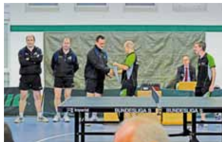
TURA begrüßt die Spieler von Turnhout...